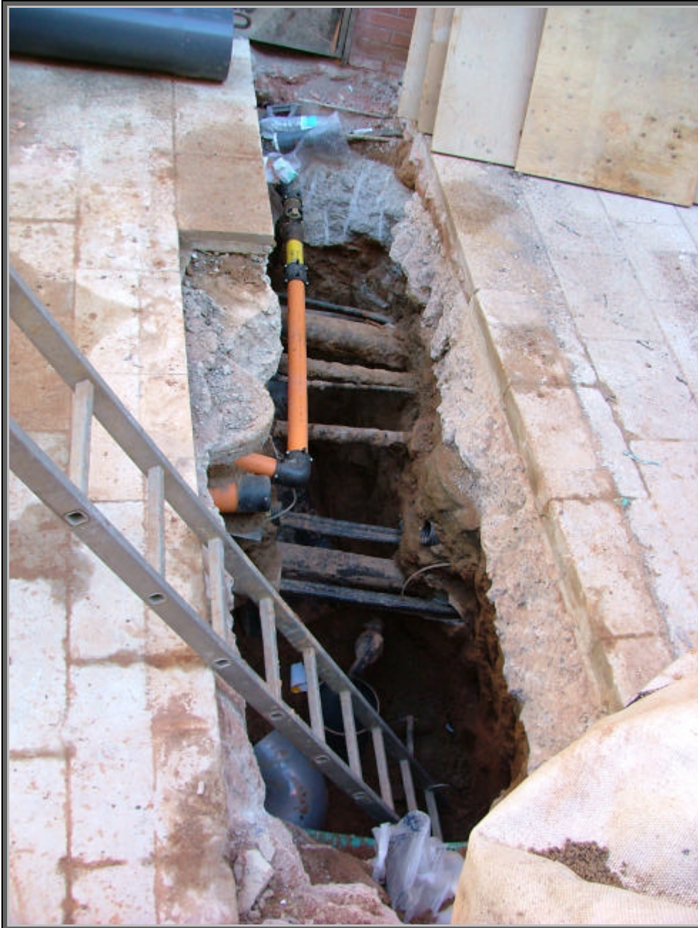
Fotografia 1: Vista General de la rasa.